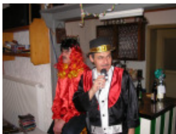
DJ-Herbi mit VfB Zirkusdirektor

Glücklicherweise waren viele Faschingsnarren bereit Ihren Umsatz an der Bar so zu gestalten, dass der geringe Besuch einigermaßen ausgeglichen werden konnte. Wie bekannt wurde, haben einige am nächsten Tag ihren heldenhaften Einsatz Tribut zollen müssen.