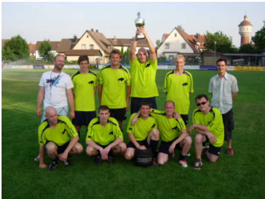
White Buffalos - Sieger Bergfestturnier 2010